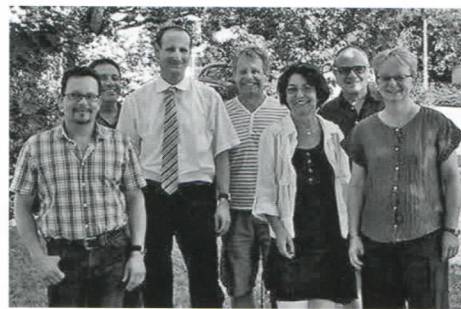
Das OK ist bereits an der Arbeit.